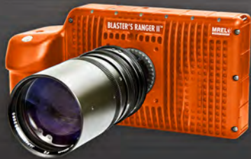
BLASTER'S RANGER II™